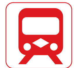
Metros e Intercambiadores